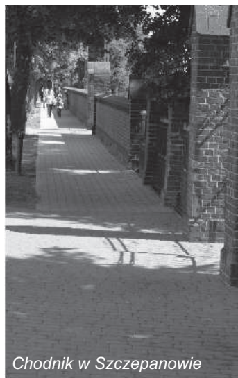
Chodnik w Szczepanowie