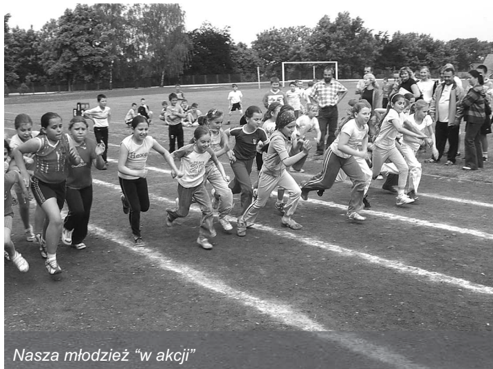
Nasza młodzież „w akcji”

Szansę na sukces dobrze wykorzystwała szkoła Podstawowa w Krynicznie, zdobywając m.in. drugie miejsce w konkursie na Inicjatywę Partnerstwa Doliny Środkowej Odry za realizację projektu „Gdy teatr jest nasz” czy pierwsze – w Gminnych Igrzyskach Młodzieży Szkolnej w mini siatkówce chłopców i drugie – w Otwartych Mistrzostwach Gmi-