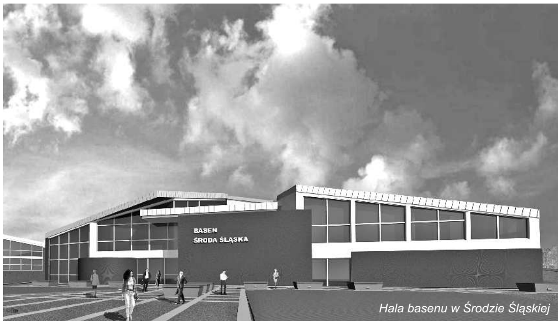
Hala basenu w Środzie Śląskiej

Wśród najbliższych planów inwestycyjnych Gminy Środa Śląska znajduje się budowa basenu właśnie w Środzie Śląskiej. Obiekt zlokalizowany będzie w północnej części miasta w rejonie ulicy Kilińskiego, na działce położonej na wzgórzu przylegającym do akwenu „Kajaki”.