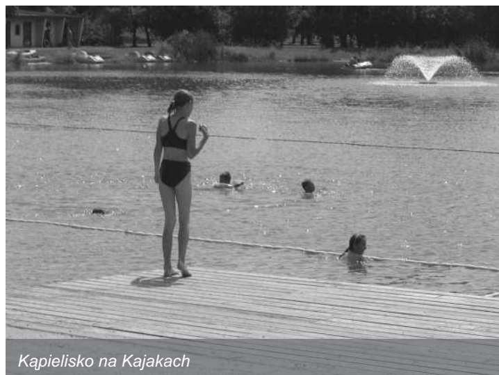
Kąpielisko na Kajakach