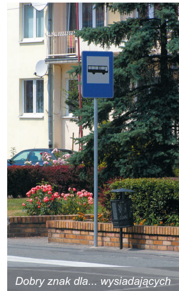
Dobry znak dla... wysiadających