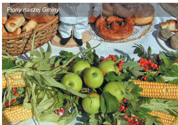
Plony naszej Gminy

Uroczystości, zgodnie z tradycją, rozpoczną się mszą dziękczynną w miejscowym kościele o godz. 13, skąd korowód dożynkowy uda się na przyszkolne boisko sportowe. W programie Święta znalazły się m.in. konkursy na „Najpiękniejszy wieniec dożynkowy” i „Chleb dożynkowy”, koncerty zespo-