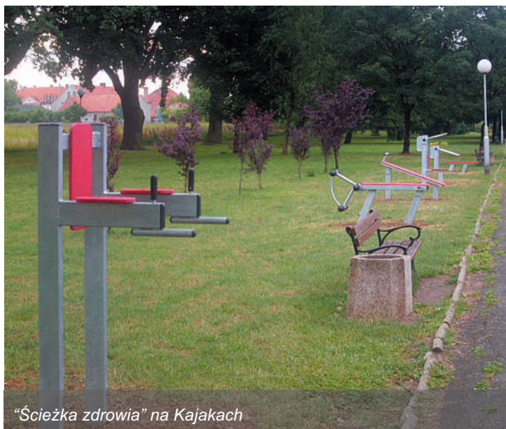
„Ścieżka zdrowia” na Kajakach