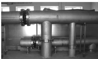
Fragment zmodernizowanej oczyszczalni ścieków

14 listopada, w siedzibie Średzkiej Wody sp. z o.o., oficjalnie zakończyła się realizacja projektu „Inwestycje w zakresie gospodarki wodno-ściekowej w miejscowościach Środa Śląska, Ciechów i Bukówek”.