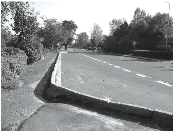
Modernizacja ul. Wrocławskiej w tym miejscu uciechy chyba najbardziej...

Ostatniego października opublikowano listę rankingową wniosków o dofinansowanie zadań w ramach Narodowego programu przebudowy dróg lokalnych (Etap II Bezpieczeństwo – Dostępność – Rozwój).