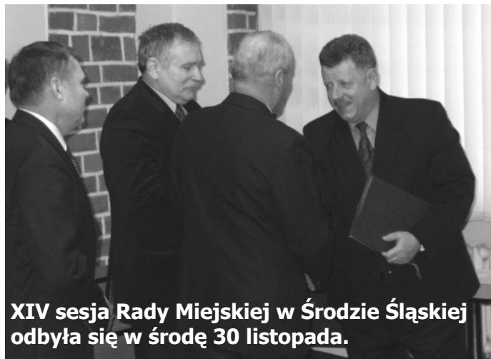
XIV sesja Rady Miejskiej w Środzie Śląskiej odbyła się w środę 30 listopada.

Obrady były dość długie, co nie dziwi, biorąc pod uwagę, że tematów poruszano dużo. Niżej przybliżamy najistotniejsze z nich.