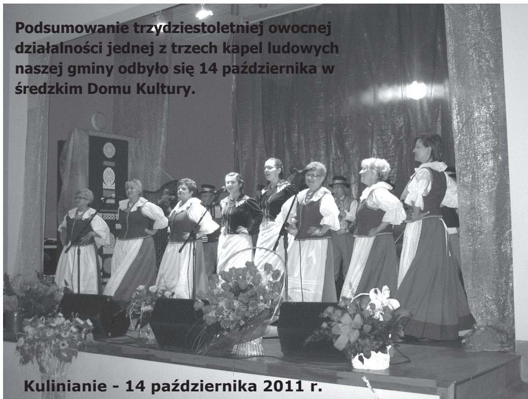
Kulinianie - 14 października 2011 r.

Podsumowanie trzydziestoletniej owocnej działalności jednej z trzech kapel ludowych naszej gminy odbyło się 14 października w średzkim Domu Kultury.