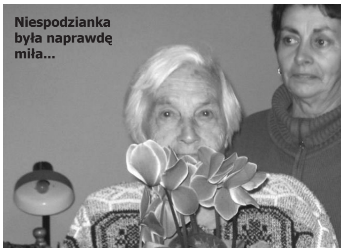
Niespodzianka była naprawdę miłą...

Obchody tegorocznego Dnia Seniora współorganizowały m.in. połączone siły średzkiego Domu Kultury, Zarządu Rejonowego PCK i Powiatowej Stacji Sanitarno-Epidemiologicznej. Inauguracja nastąpiła podczas balu seniora 6 października. 11 października odbyło się pierwsze z cyklu Wtorkowych Spotkań Towarzyskich.