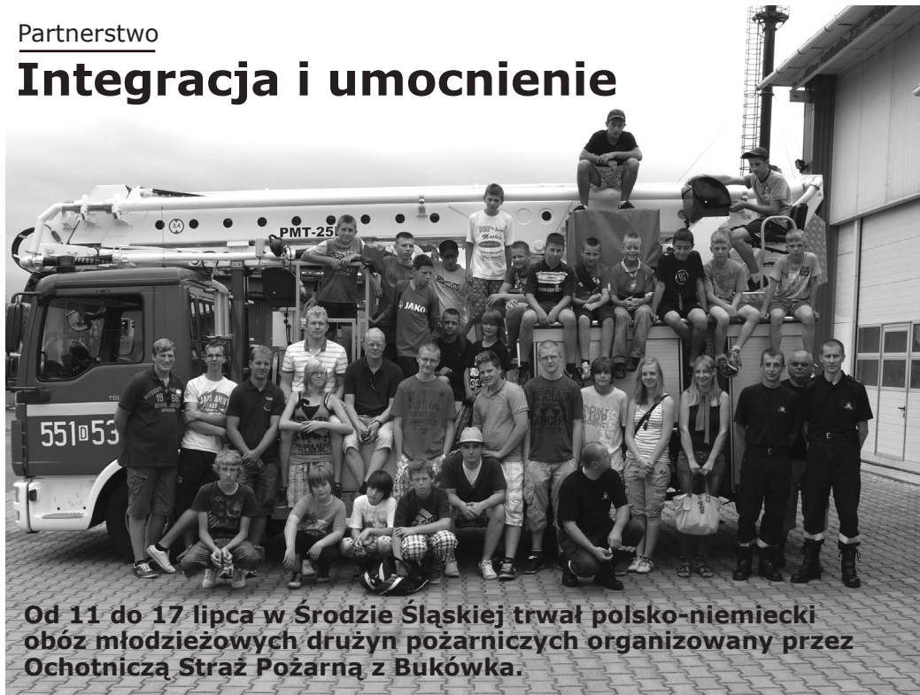
Od 11 do 17 lipca w Środzie Śląskiej trwał polsko-niemiecki obóz młodzieżowych drużyn pożarniczych organizowany przez Ochotniczą Straż Pożarną z Bukówką.

Wymiana strażackiej młodzieży, to jedna z form trwającego od roku 2002 partnerstwa OSP Bukówek i jednostki OSP z Ramsloh (gmina Saterland) z północnych Niemiec. Obozy tego typu odbywają się przemiennie co 2 lata. Co 4 lata gospodarzem jest OSP Bukówek i co 4 lata FF Ramsloh. W tegorocznym wzięło udział po piętnastu uczestników z obu jednostek.