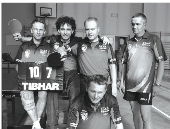
ULKS CIECHÓW - majowi zwycięzcy

nizować zajęcia z tenisa stołowego dla dzieci. Zależało nam