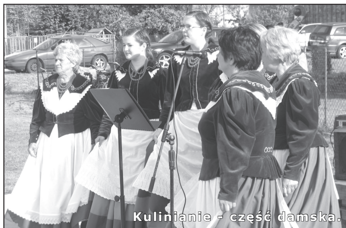
Kulinianie - część damska.

nie po wakacjach, na sąsiadujących ze ścisłym centrum miasta ulicach wprowadzone zostaną pewne zmiany organizacji ruchu kołowego. O szczegółach będziemy informować na bieżąco. (j.l.)