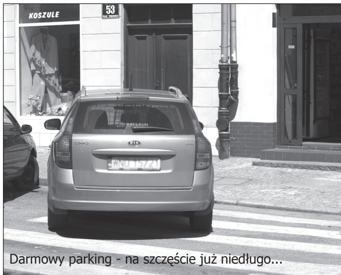
Darmowy parking - na szczęście już niedługo...

Nic dziwnego, że projekt przedmiotowej uchwały nie od razu trafił pod głosowanie. - Pracowaliśmy nad uchwałą długo, ale dzięki temu wybraliśmy opcję najbardziej przyjazną mieszkańcom – podkreśla burmistrz Bogusław Krasucki .