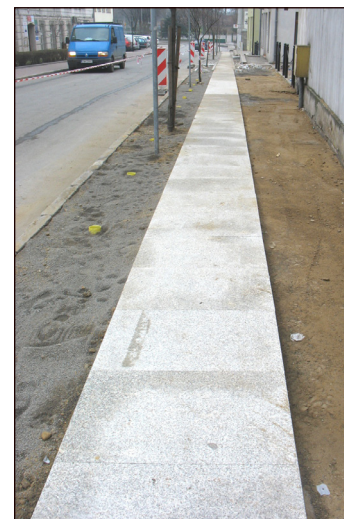
Na ul. Wawrzyńca Korwina także inwestycyjna wiosna...

Inwestycja zostanie wykonana i dofinansowana w ramach tzw. schetyńówek (Narodowego programu przebudowy dróg lokalnych. Etap II Bezpie-