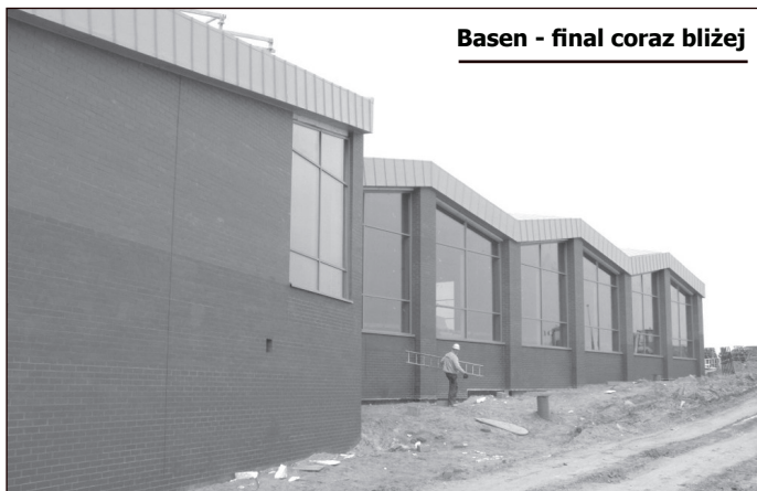
Basen - final coraz bliżej

nie z zapisami umowy przewidziany jest na drugą połowę br., a do 30 lipca ma być zakończona budowa drogi dojazdowej do obiektu. Będzie to przedłużenie ul. Górnej, a połączy się z ul. Kilińskiego na wysokości Ośrodka Szkolno-Wychowawczego. Integralną częścią ciągu komunikacyjnego będzie chodnik i oświetlenie z lamp typu LED.