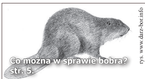
Co można w sprawie bobra? str. 5.