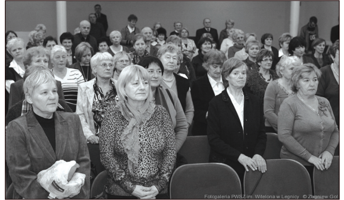
Fotogaleria PWSZ im. Witelona w Legnicy © Zbigniew Gol

Po Legnicy i Jaworze przyszła kolej także na Środę Śląską. Inauguracja działalności Uniwersytetu Trzeciego Wieku legnickiej Państwowej Wyższej Szkoły Zawodowej im. Witelona miała miejsce 22 lutego br. w średzkim Domu Kultury.