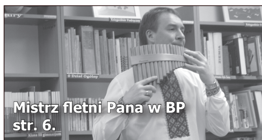
Mistrz fletni Pana w BP str. 6.