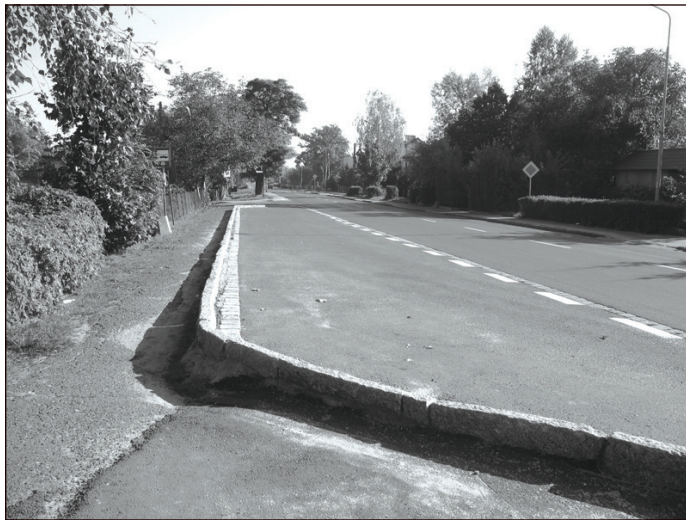
Modernizacja ul. Wrocławskiej w tym miejscu uciechy chyba najbardziej...

Proinwestycyjne nastawienie samorządu gminy Środa Śląska znane jest nie tylko mieszkańcom. Zrównoważony rozwój to m.in. ciągły ruch na placach budów czy obiektach już istniejących a wymagających, naturalną kolejną rzeczą, modernizacji lub remontu.