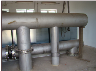
Średzka Woda sp. z o.o., we fragmencie.

Gazele Biznesu to ranking najdynamiczniej rozwijających się małych i średnich firm przeprowadzony po raz pierwszy dwanaście lat temu.