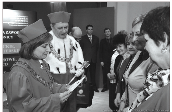
Fotogaleria PWSZ im. Witelona w Legnicy

Indeksy wręczono blisko siedemdziesięciorgu słuchaczom. Po akcie immatrykulacji, czyli przyjęcia nowych