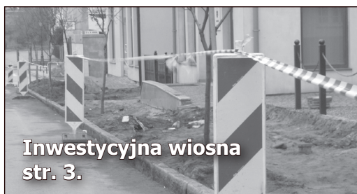
Inwestycyjna wiosna str. 3.